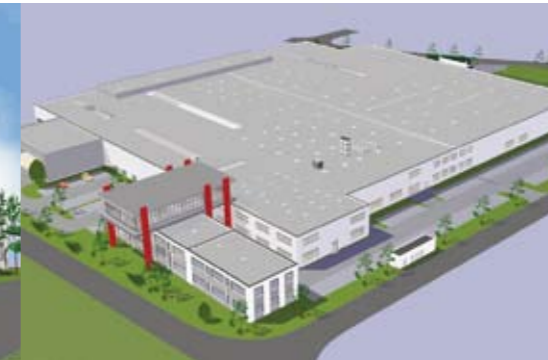
...was einen deutlichen Ausbau des erst 2004 gebauten Werkes in Fläche und Kapazität zur Folge hat.