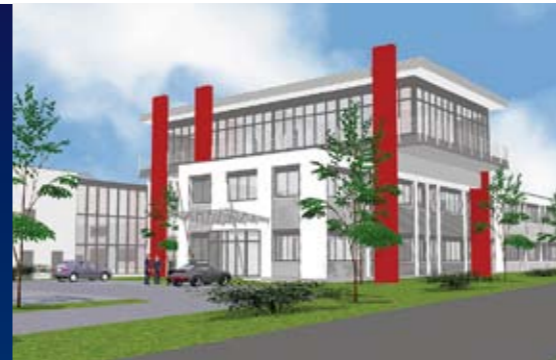
Wegmann Automotive zentralisiert die Führung aller Niederlassungen und Auslands-töchter in Würzburg...